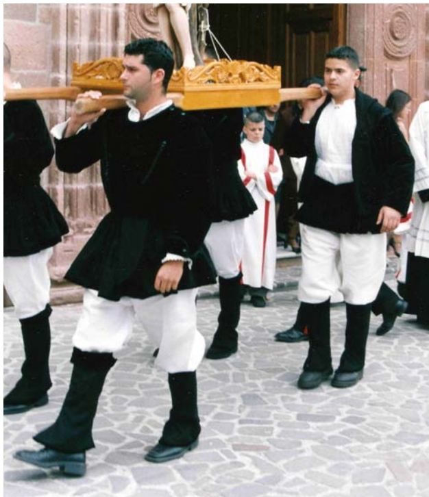
costumi maschili della pro-loco in primo piano col zippone il secondo piano con una gabbanella di orbace