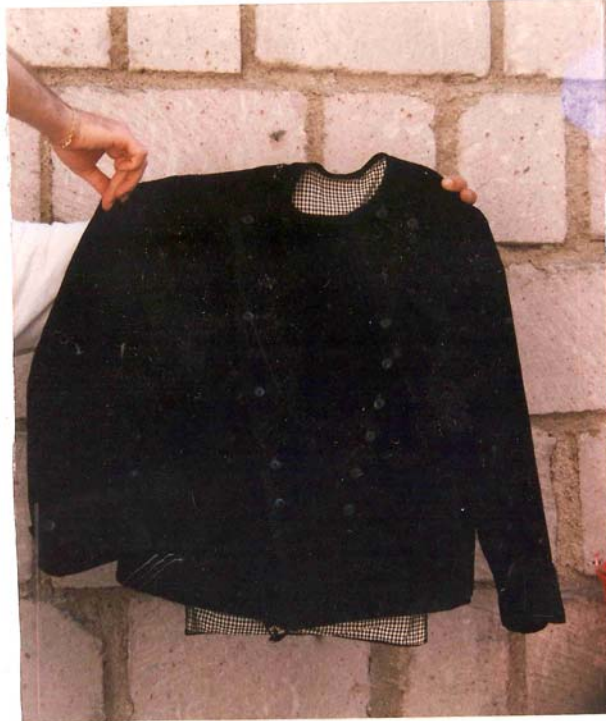
Zipponi originale in velluto dal quale è stata realizzata la ricostruzione.